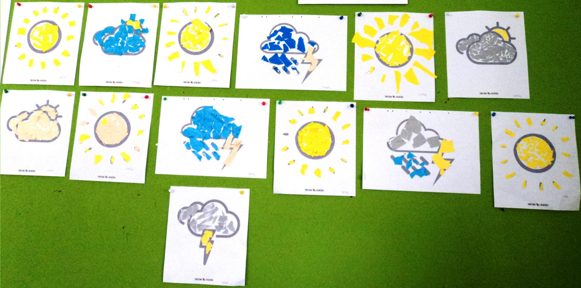
Oto efekt pracy „Kotków”. Gratulacje pracusie!

Kwiecień tuż jest - czasem słońce, a czasem deszcz