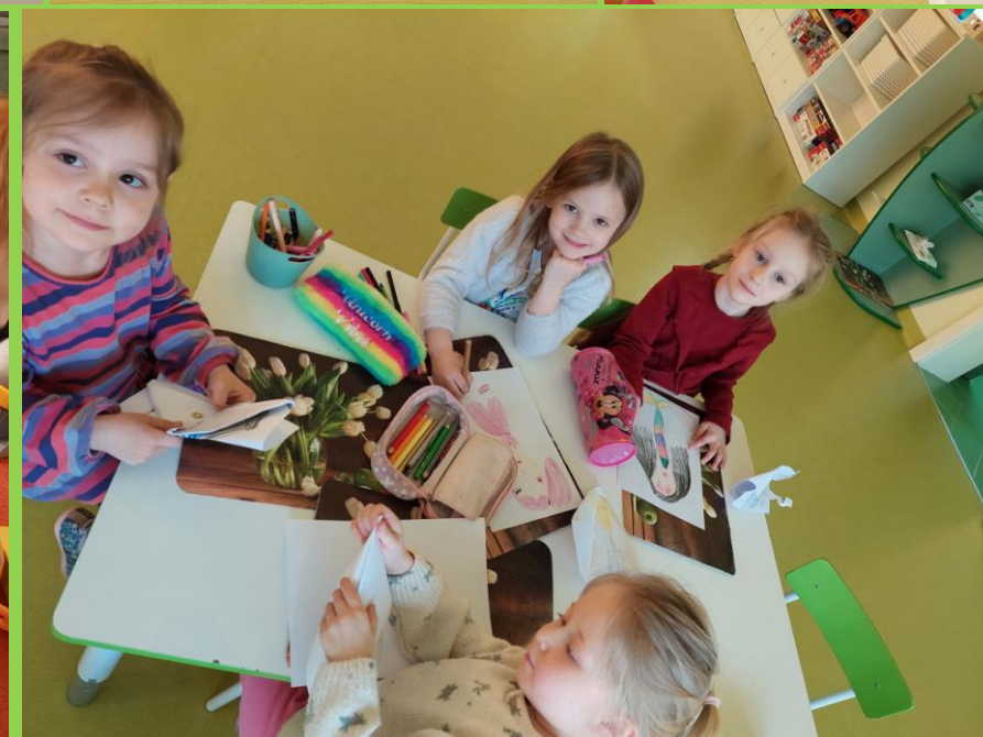
Wspólne zabawy wspaniale integrują grupę.