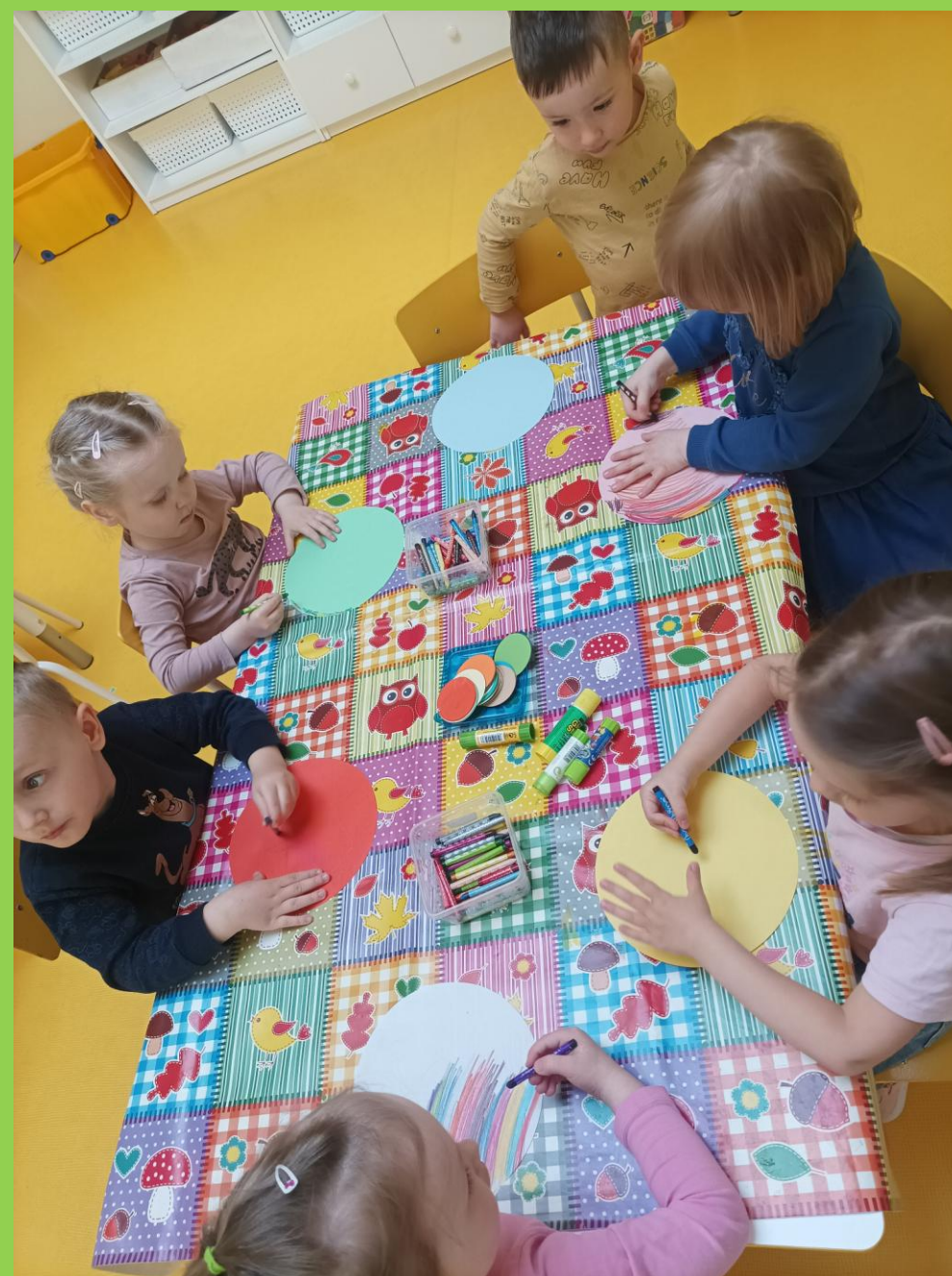
Kolorowe piłki przygotowane na „Rodzinny piknik”