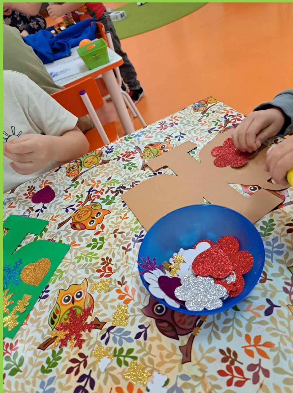
„Kotki” przygotowują prezenty dla babci i dziadka.