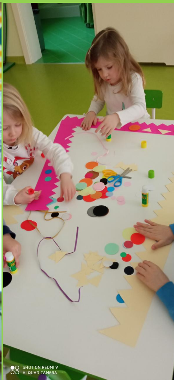
Przedszkolaki tworzyły korony według własnego pomysłu.