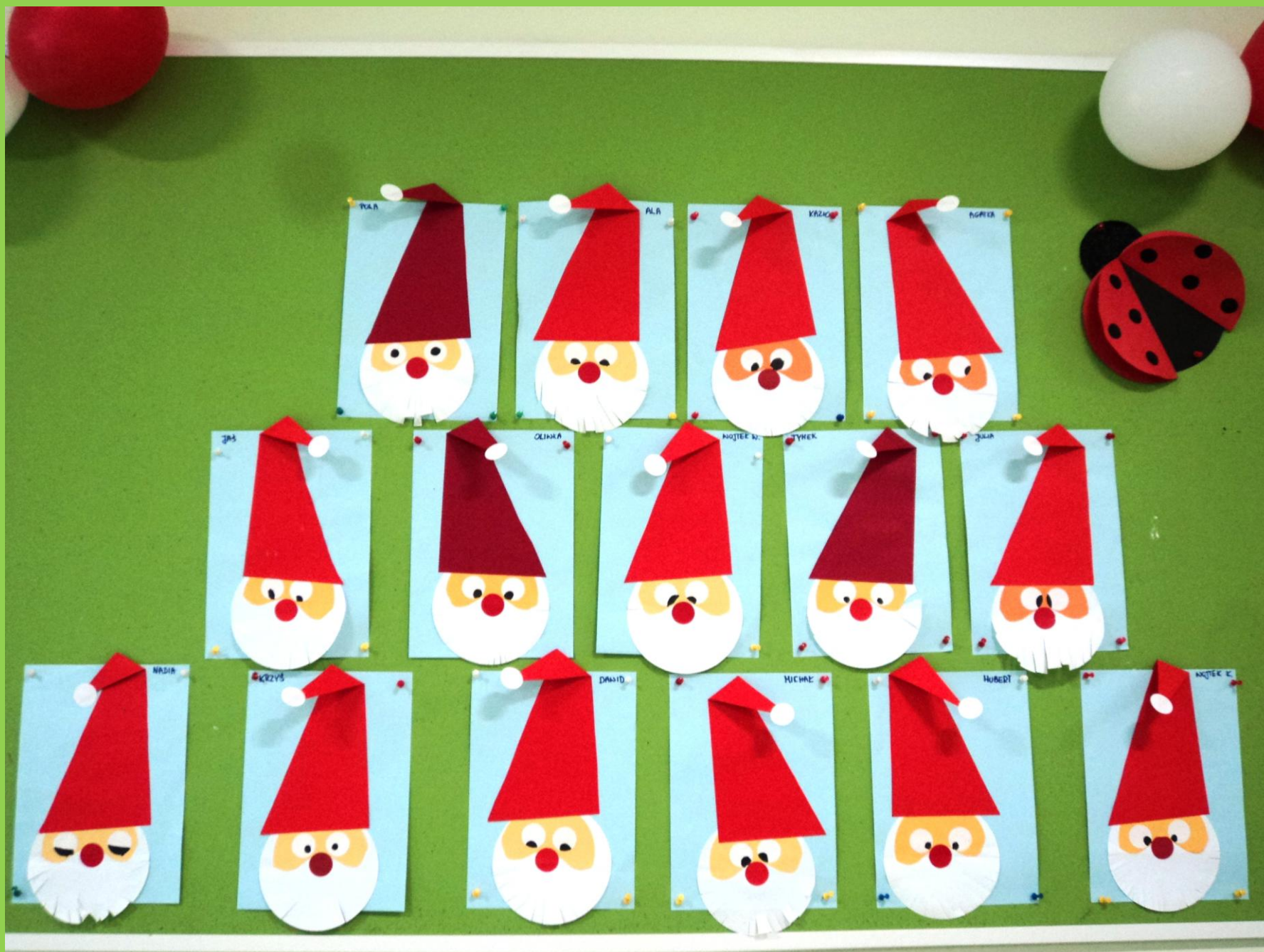
„Biedronki” przygotowały portrety Mikołaja.