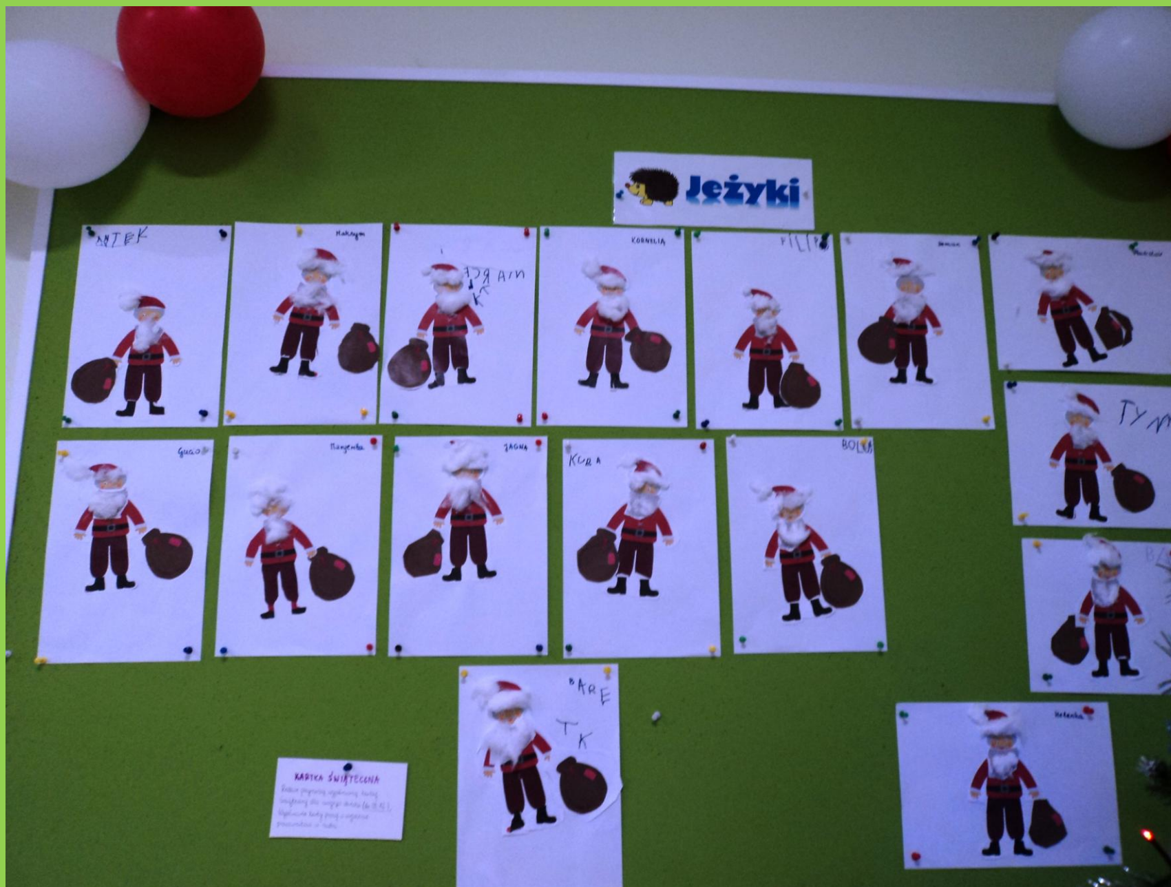
„Jezyki” stworzyły postać św. Mikołaja.