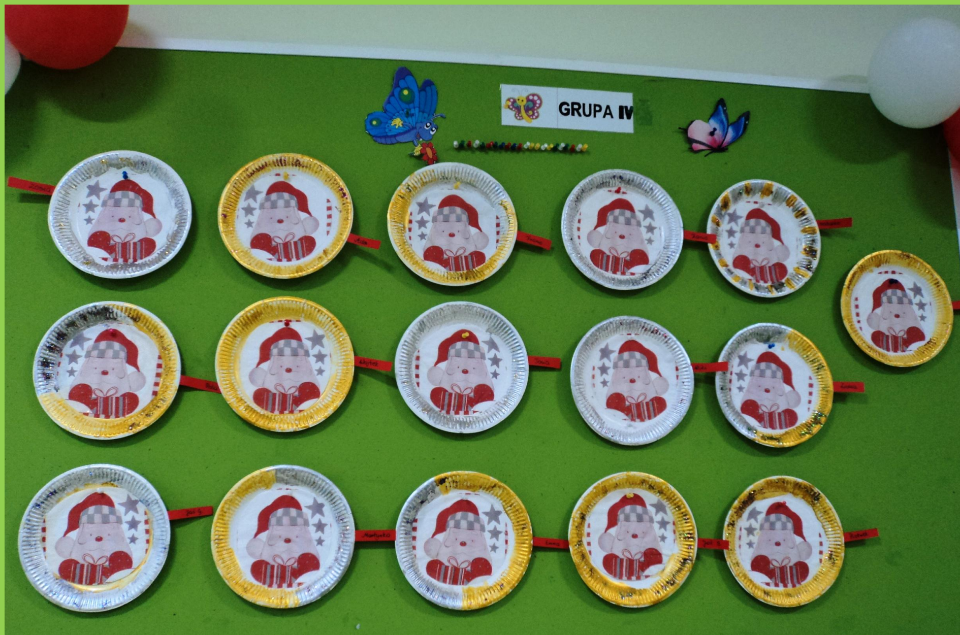
„Motylki” stworzyły portrety Mikołaja na papierowych talerzykach.