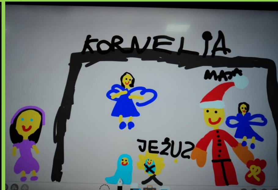
Dzieci z grupy V „Rybki” bardzo lubią rysować na tablicy multimedialnej.