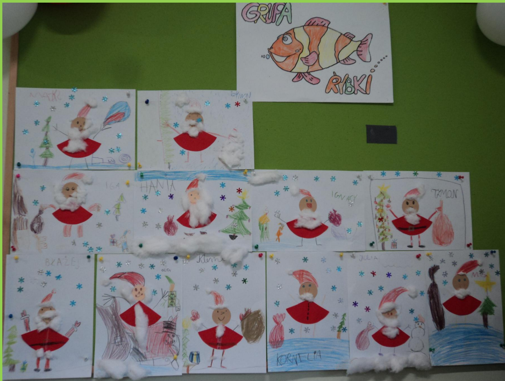
„Rybki” stworzyły mikołajkowe kolaże.