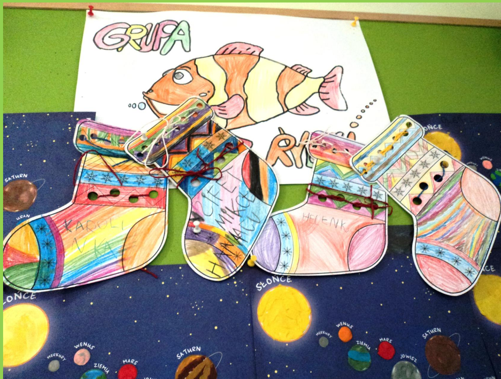
„Rybki” stworzyły świąteczne skarpety.