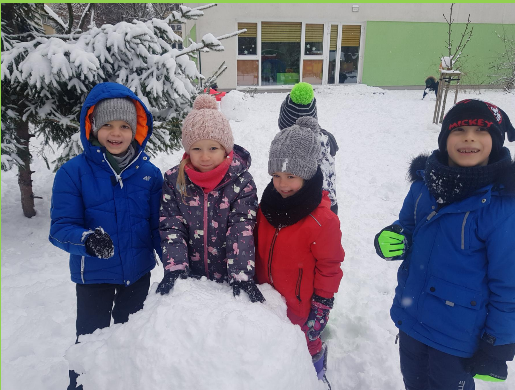
Dzieci w zabawie na śniegu poznają jego właściwości.