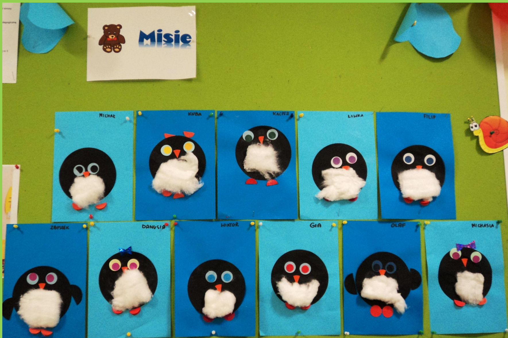
„Pingwinki” –praca plastyczna „Misiów”